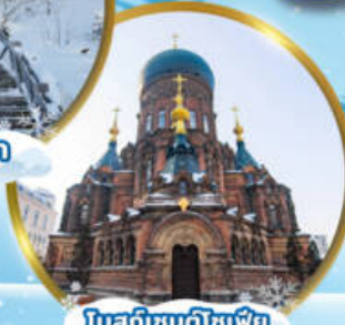
โบสถ์เซนต์โซเฟีย