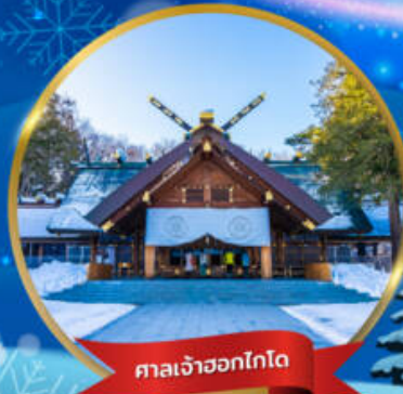
ศาลเจ้าออกโทโด