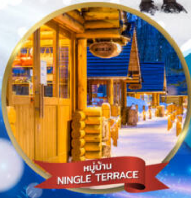
หมู่บ้าน NINGLE TERRACE