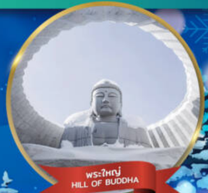
พระใหญ่ HILL OF BUDDHA

พักอาซาฮิคาว่า 1 คืน - โอดารุ 1 คืน - ซัปโปโร 2 คืน (ติดย่านช้อปปิ้ง)