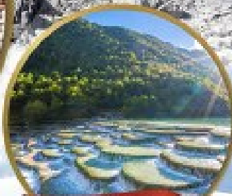
หุบเขาพระจันทร์สีน้ำเงิน