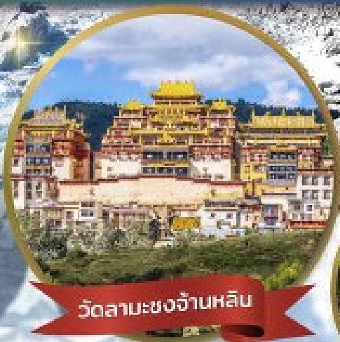
วัดลามะชงจ้านหลิน