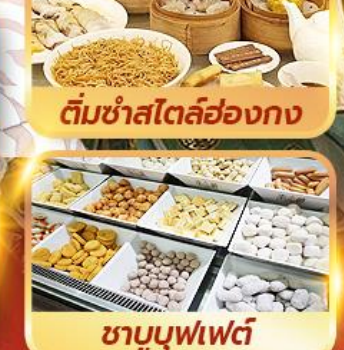
ติ่มซำสไตล์ฮ่องกง