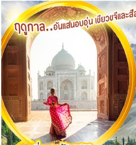
เที่ยวชมทัชมาฮาล

ฤดูกาล...อันแสนอบอุ่น เขียวขจีและสีส้มของดอกไม้ป่า