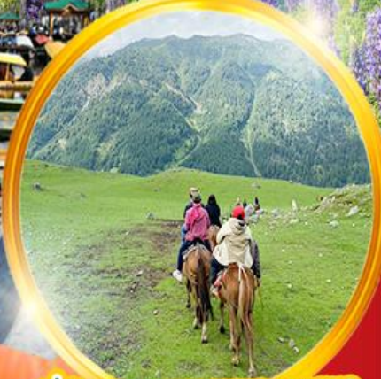
ขี่ม้าชมความงามของหุบเขา