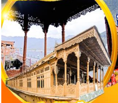
บ้านเรือสมัยวิทอเรีย