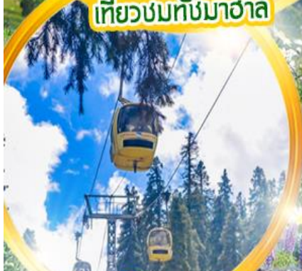
กระเช้า gondolá 360 องศา