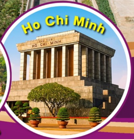
Ho Chi Minh