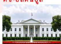
The White House

16.00 น. นำท่านเดินทางสู่สนามบินดัลเลส 21.45 น. ออกเดินทางสู่อิสตันบูล ประเทศตุรกี เที่ยวบิน TK8