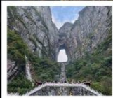
เขากิ๊ยนเหมินซาน

จางเจียเจีย • เขาวงตาร • ฟังหวง • ฟู่หงเจิ้น • ฉางซา