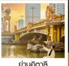
ย่านอิตาลี