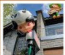
ถนนคนเดินระหว่งชางเกน