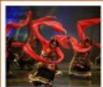
โซวทิเน็ต