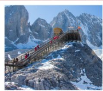
ภูเขาหิมะมังกรหยก

เมืองโบราณด้าหลี่ / เจดีย์สามองค์ / โถงแรกแม่น้ำแยงซี / เมืองโบราณเซงกรีล่า วัดลามะชงจันหลิง / ซ่องแคบสี่กักระโดด / เมืองโบราณซูเหอ / ภูเขาหิมะมังกรหยก หุบเขาพระจันทร์สีน้ำเงิน / โข่วจางอวี๋หมว / สระน้ำมังกรดำ - เมืองโบราณลี่เจียง เขาซีซาน / ประตุมังกร / วัดหยวนทง / สวนด้ากวนโหลว