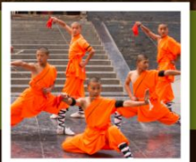
โชว์เส้าหลิน