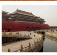
พระราชวังกู่กง