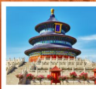
หอบูชาเทียนถาน