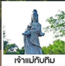
เจ้าแม่ก๊กกิม