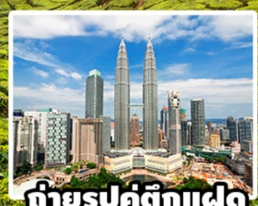
ถ่ายรูปคู่ตึกแฝด