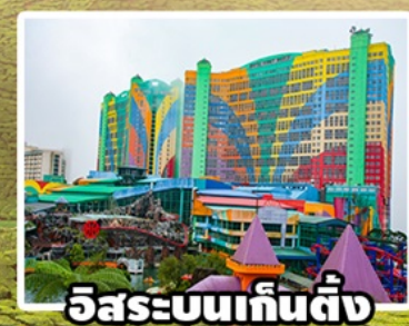
อิสระบนเก็นติ้ง