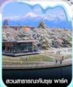
สวนสาธารณะคันซุย พาร์ค

คอนเฟิร์มออกเดินทาง ทุกพีเรียด 2 ท่านขึ้นไป