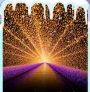
งานประดับไฟนาบานะโนะซาโตะ