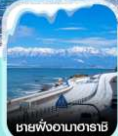
ชายฝั่งอามาฮาราชิ