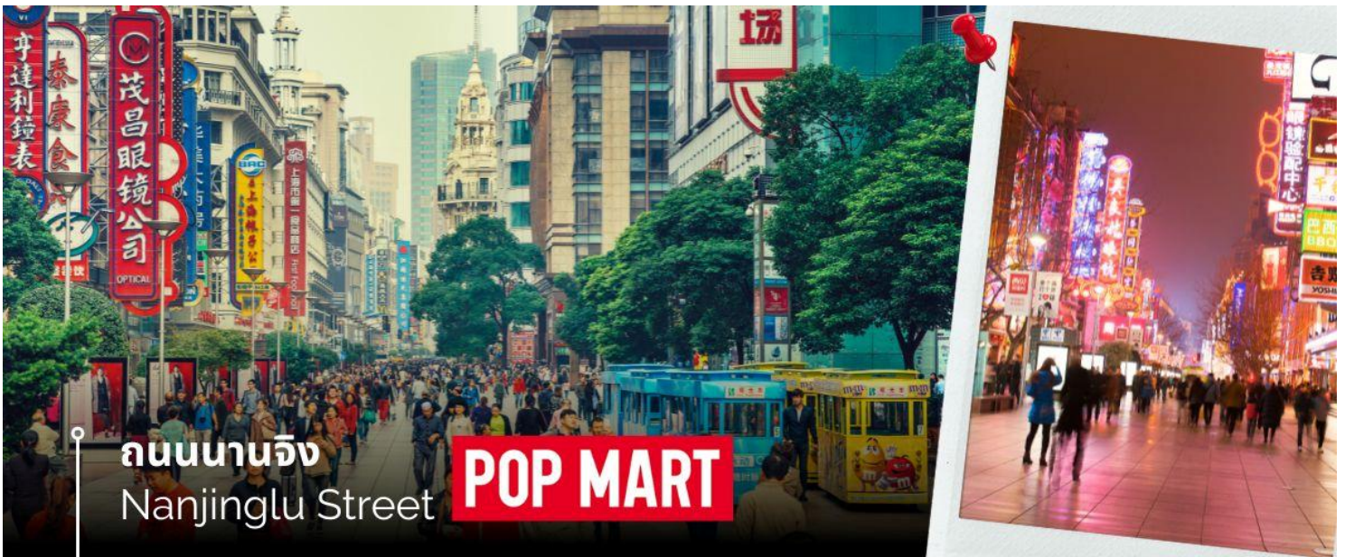
ถนนนานจิง Nanjinglu Street POP MART

นำท่านสู่บริเวณ หาดไว่ทาน ตั้งอยู่บนฝั่งตะวันตกของแม่น้ำหวงผู้มีความยาวจากเหนือจรดใต้ถึง 4 กิโลเมตรเป็นเขตสถาปัตยกรรมที่ได้ชื่อว่า “พิพิธภัณฑ์สิ่งก่อสร้างหินปูนแห่งชาติจีน” ถือเป็นสัญลักษณ์ที่โดดเด่นของนครเชียงใหม่ ไฮ้ และนำท่านช้อปปิ้งย่าน ถนนนานจิง Nanjinglu Street ศูนย์กลางสำหรับการช้อปปิ้งที่คึกคักมากที่สุดของนครเชียงใหม่ ไฮ้ รวมทั้งห้างสรรพสินค้าใหญ่ชื่อดังกว่า 10 แห่ง และช้อปปิ้ง ร้าน POP MART สุดฮิตในขณะนี้เพื่อเป็นของฝากที่ระลึกให้แก่ญาติสนิทมิตรสหาย