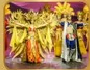
ชมการแสดงโขนจีน