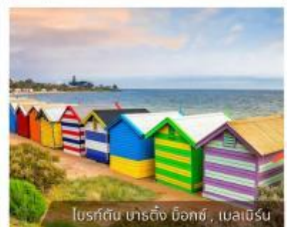
โบสถ์สีรุ้ง บาร์คิง น็อกซ์, เมลเบิร์น