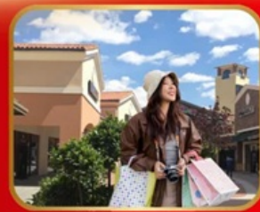
อิสระช้อปปิ้ง BEIJING OUTLET