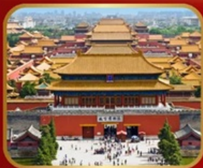
เขื่อนมรดกโลก พระราชวังกู้กิง