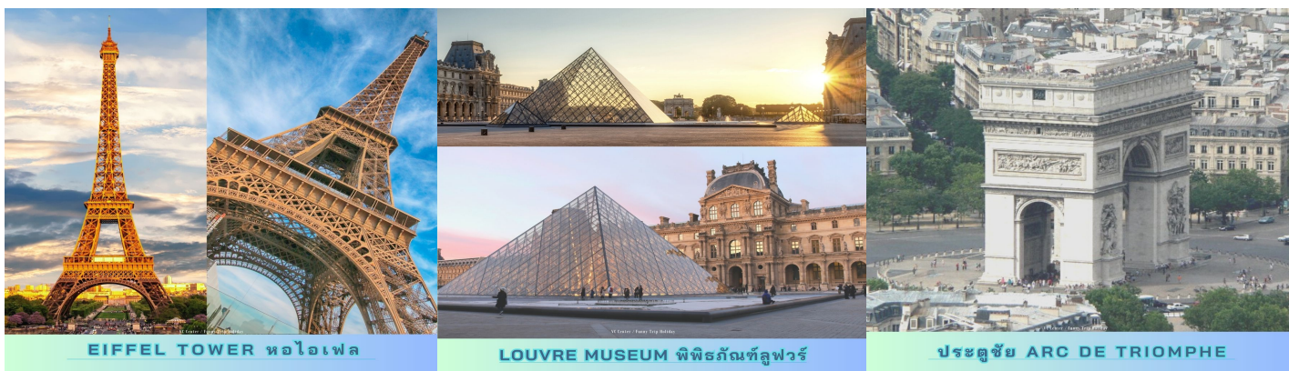
EIFFEL TOWER หอไอเฟล

นำท่าน ชมหอไอเฟล (EIFFEL TOWER) ซึ่งเป็นสัญลักษณ์ของกรุงปารีส เลิศหรู อลังการ โรแมนติก มหัศจรรย์ ด้วยความสูง 984 ฟุต สร้างด้วยโครงเหล็กทั้งหมด...ถนนชองเซลีเซ (CHAMPS-ELYSEES) ถนนที่มีต้นไม้เรียงรายทั้งสองข้างทางอย่างน่าเดินเล่น ต้นแบบถนนราชดำเนิน ปลัซเดอลา คอนคอร์ด์ (PLACE DE LA CONCORDE) จตุรัสแห่งความสามัคคี โบสถ์แมดดีแลน ที่สร้างแบบกรีกโบราณ ถ่ายรูปกับปิระมิดหน้าพิพิธภัณฑ์ลูฟวร์ หรืออดีตพระราชวังลูฟวร์ จากนั้นนำท่าน ชมเมืองปารีส มหาราชินีแห่งเมืองหลวงของโลก ..ถ่ายรูปคู่กับประตูชัย (ARC DE TRIOMPHE) ของพระเจ้านโปเลียนอาร์ค เดอทร็อม ให้ท่านช้อปปิ้งสินค้าแบรนด์เนมที่มีชื่อเสียง ณ ห้างแกลอรีลาฟาแยส เช่น หลุยส์,