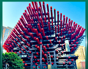
เขื่อนตึกตะเกียบ