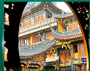
วอพรวัดหลิวฉัน