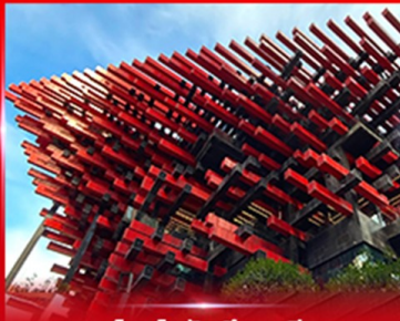
แลนด์มาร์คดิง ตึกตะเกียบ