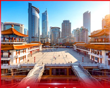
เซ็กฉิน ตึกโค่วซิงโห

OPTION ซีตี้วอร์ดซิ่ง ชมแพนด้า, POPMART, ซ็อบบี้, ถนนคนเดิน