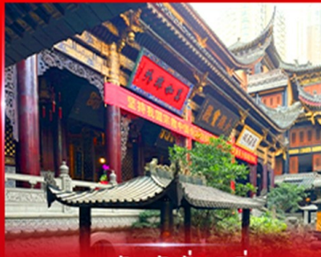
วอพรวัดหลิวฉิน ฉงชิ่ง