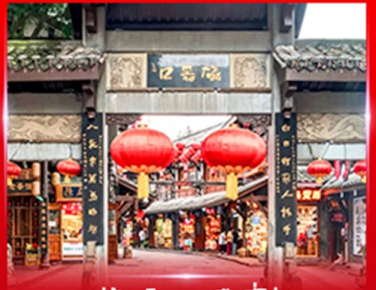
หมู่บ้านโบราณฉิวฉีโหว