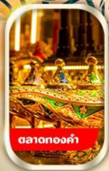
ตลาดทองคำ