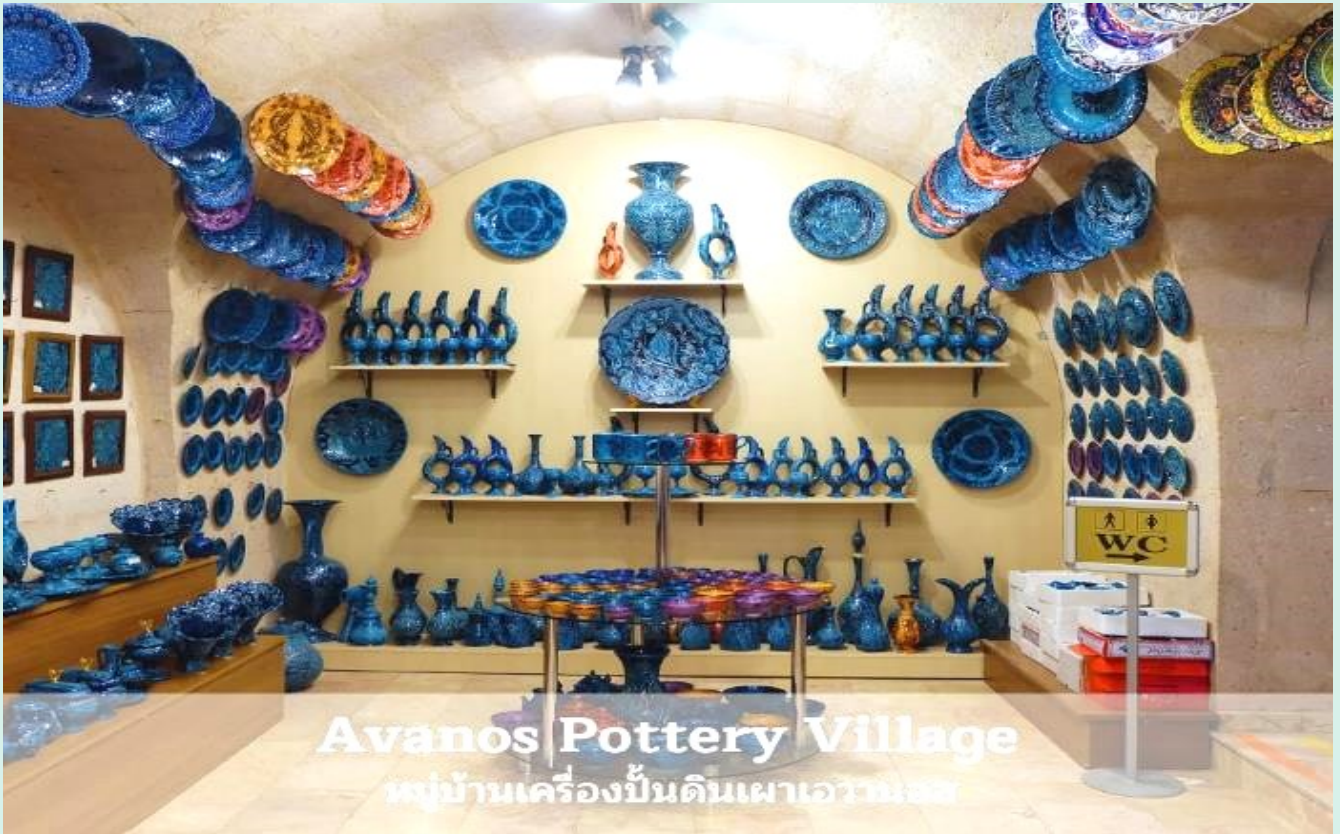
Avanos Pottery Village หมู่บ้านเครื่องปั้นดินเผาเอวานอส

เย็น รับประทานอาหารเย็น ณ ห้องอาหารของโรงแรม ที่พัก 📍 CAPPADOCIA HOTEL หรือเทียบเท่า