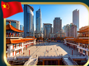
เขี่ยคินตึกไคว่ซังโหล