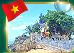
สักการะขอพรศาลเจ้ามังกร