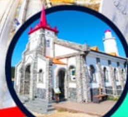
โบสถ์คริสต์จุกซอง