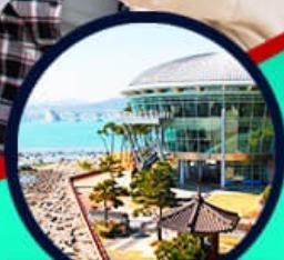
เอเปคเฮาส์ บุรีมารู