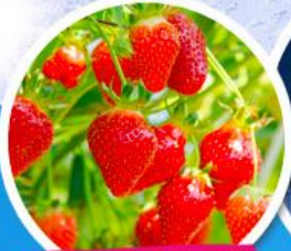
ไร่สตอร์รี่เบอร์รี่