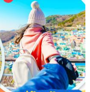
หมู่บ้านคัมซอน

สายการบินแอร์ปูซาน (BX) <ชั้นเครื่องสุวรรณภูมิ>