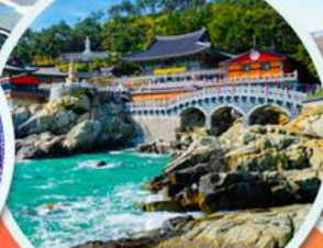
วัดแฮดง ยงกุงซา