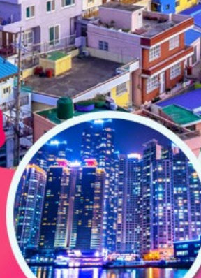
The Bay 101