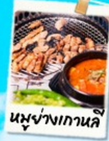
นหม่างเกาหล