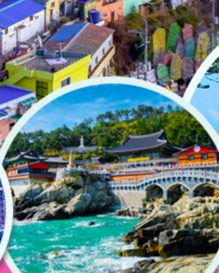
วัดแฮดง ยงกุงซา