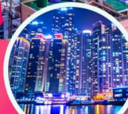
The Bay 101