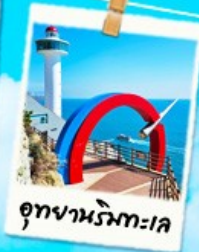
อุทงานร้ทะเล