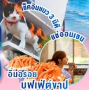
ชิคอินแพว 3 ไม้ แฉ้ออนเซน อิมอร้อย บุฟเฟ่ต์งปู

ไฮไลท์!! สัมผัสความงามของดอกซากุระก่อนใคร ณ เมืองคาวาซึ ชมงานประดับไฟที่หมู่บ้านเยอรมัน 1 ใน 10 งานประดับไฟที่สวยงามที่สุดในญี่ปุ่น ขึ้นภูเขาไฟฟูจิชั้น 5 หรือ เล่นสกี ณ ฟูจิเท็นสกีรีสอร์ท (ขึ้นอยู่กับสภาพอากาศ) สักการะสิ่งศักดิ์สิทธิ์ ณ วัดอาซากุสะ พร้อมเดินชม ของอร่อยๆ ที่ ถนนนากามิยะ-