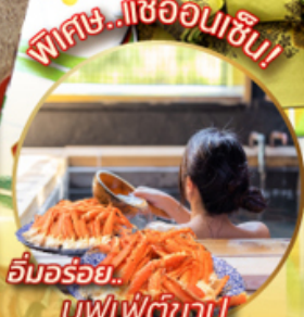
อิมมอร้อย... บุฟเฟต์ชาบู