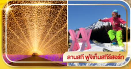
ลานสกี ฟุจิกั้นสกีรีสอร์ท