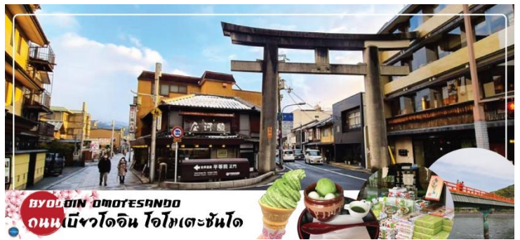
BYODOIN OMOTESANDO ถนนเบียวโดอิน โอโมเตะซันโด

สุดถนนแล้ว จะเจอ สะพานอุจิ (Uji Bridge) หนึ่งในสามสะพานเก่าแก่ที่สุดในญี่ปุ่น สร้างขึ้นในปี ค.ศ. 646 อายุคร่าวๆ ประมาณ 1,370 ปี เกือบพังทลายมาแล้วหลายครั้งจากสงคราม น้ำท่วม และแผ่นดินไหว แต่ทุกครั้งชาวเมืองก็ร่วมพลังกันซ่อมแซมจนกลับมาใช้งานได้อีกครั้ง และยึดหยัดมาจนถึงวันนี้ กลายเป็นมรดกทางประวัติศาสตร์ของชาวเมืองอุจิ