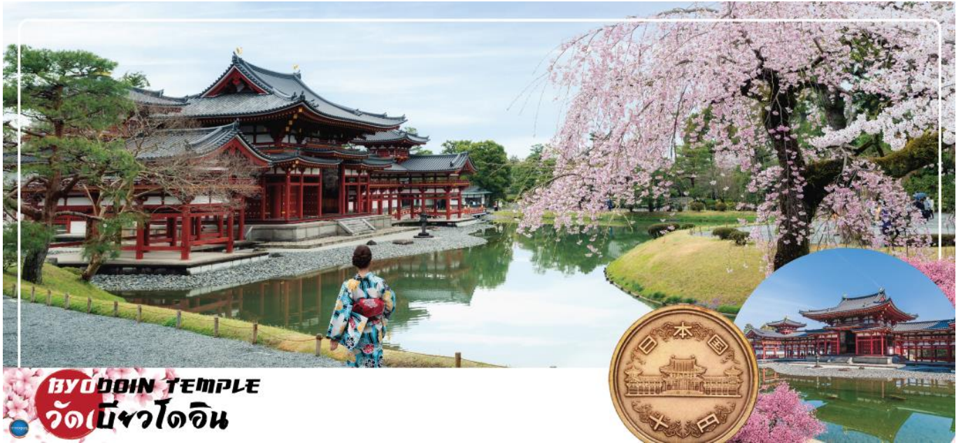
BYODOIN TEMPLE วัดเบียวโดอิน

นำท่านเดินทางสู่ เมืองอุจิ (Uji) เมืองเล็กๆ ทางตอนใต้ของเกียวโตหนึ่งในแหล่งปลูก "ชาเขียวอุจิ" ที่ดีที่สุดในญี่ปุ่น ซึ่งมีแม่น้ำอุจิสายสำคัญ และเป็นต้นกำเนิดของวัฒนธรรมเก่าแก่ต่างๆ