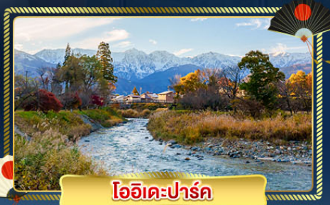
โออิเคะปาร์ค