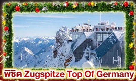
พีชิต Zugspitze Top Of Germany