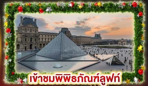
เจ้าชมพิพิธภัณฑ์ลูฟร์