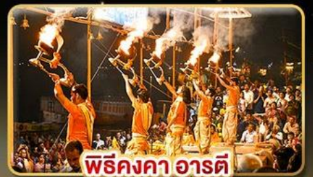
พิธีคองคา อารตี