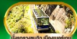
นั่งรถรางชมวิว เมืองเบอร์เกน