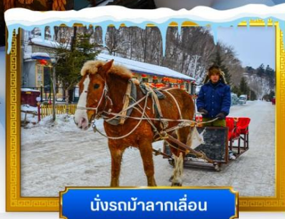
นั่งรถม้าลากเลื่อน