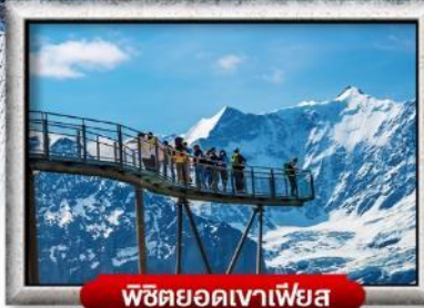
พิชิตยอดเขาเพียส