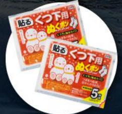
แผ่นความร้อนสำหรับ ให้ความอบอุ่นร่างกาย

2. บนเกาะโอลค์ฮอนจะมีอากาศหนาวมากต้องเตรียมกระติกน้ำเก็บความร้อนแบบพกพาได้ไปด้วย เพื่อต้มน้ำให้ความอบอุ่นร่างกาย