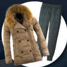
เสื้อและกางเกง กันหนาว, กันลม