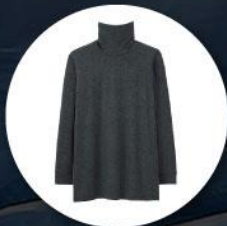
Heattech (ฮิกเทค) แบบหนาพิเศษ ทั้งกางเกงและเสื้อ

1. เสื้อผ้าควรเตรียมเสื้อผ้าสำหรับป้องกันความหนาวใช้ในอุณหภูมิต่ำสุด -40 องศาโดยประมาณ