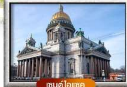
เซนต์ไอแซค