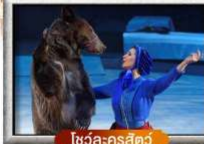
โชว์ละครสัตว์