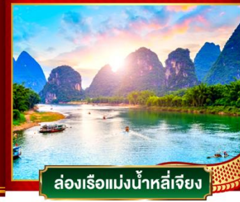
ล่องเรือแม่น้ำหลีเจียง