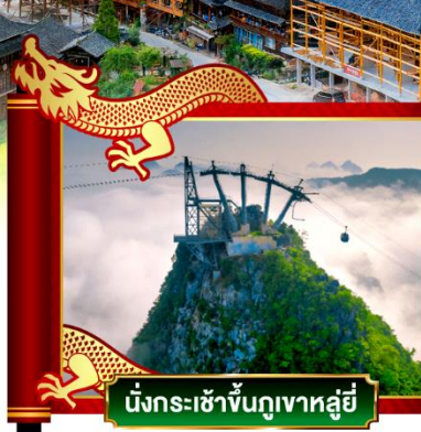
นั่งกระเช้าขึ้นภูเขาหลูอี้