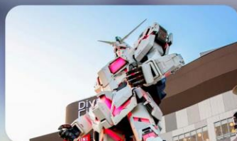
ช้อปปิ้งโอไดบะ