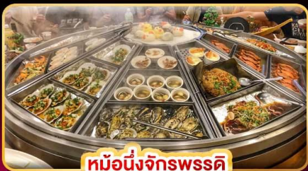
หม้อหนึ่งจักรพรรดิ