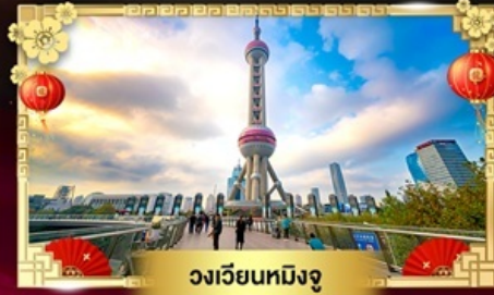
วงเวียนหมิงจู