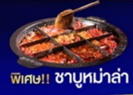
พิเศษ!! ชาบูหม่าล่า