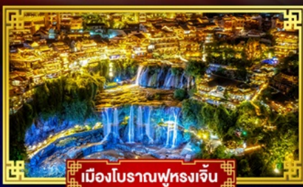
เมืองโบราณฟุทงเจิน