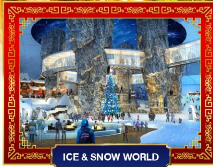
ICE &amp; SNOW WORLD