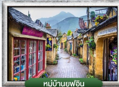
หมู่บ้านยูฟูอิน