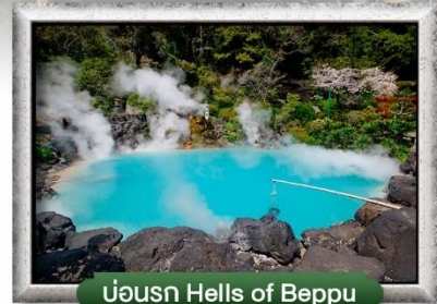
บ่อน้ำ Hells of Beppu