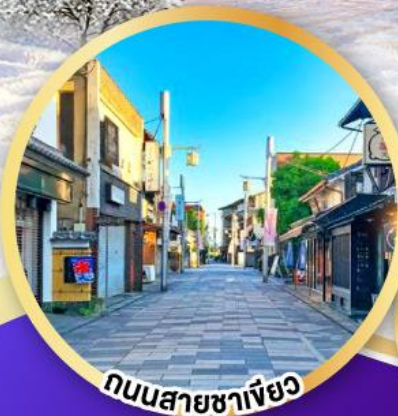
ถนนสายชาเขียว