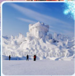
งานแกะสลัก เกาะพระเจ้ากิตย